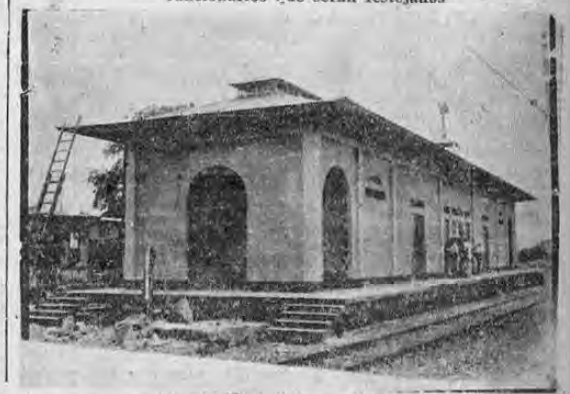
Asistirá el señor presidente de la república con un grupo de funcionarios que serán festejados

de dos mil dólares o firma "Agencias Unidas" de esta capital, que tiene en el país una representación de importantes casas comerciales del exterior, estableció una demanda contra el estado, a fin de que se le obligara a la devolución de una suma